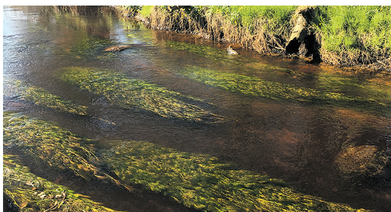
Vandranunkel danner fine puder, der giver skjulested for fiskene.

Læs mere på www.ogro.dk eller kontakt os på tlf. 5156 4729